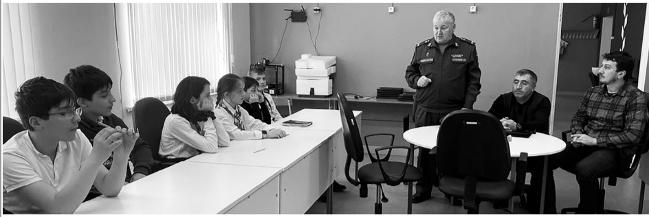
3 февраля в Сергокалинской СОШ №1и №2 прошли мероп-