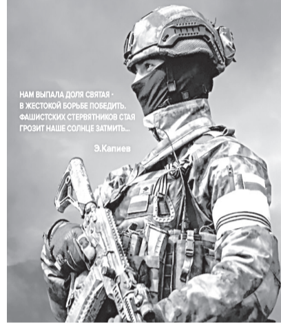
НАМ ВЫПАЛА ДОЛЯ СВЯТАЯ - В ЖЕСТОКОЙ БОРЬБЕ ПОВЕДИТЬ «ФАШИСТСКИХ СТЕРВЯТНИКОВ» СТАЛО ГРОЗИТ НАШЕ СОЛНЦЕ ЗАТМИТЬ... Э. Капиев