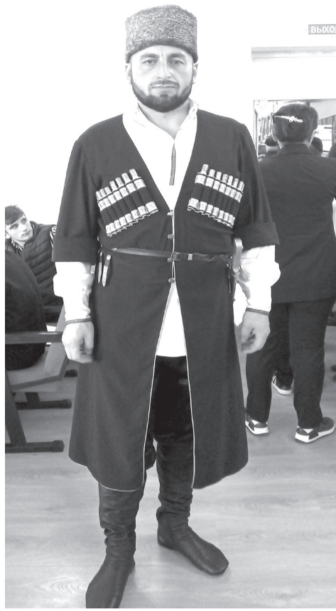
балбикахъили каибси жикъила

Г1е, гъарли-марли, шадлихъла къушум жагабируси далайчи сай, далайла ва делхъла пагъмургачибли жявх1ейчибадал машгурбиубси Убях1 Мулебк1ила шилизив ак1убси, г1ур сунезибси чихъси пагъмула шалати нур алавти шимази разидешличил ва сахаватли тинт1дирули далайик1уси урши Заур. Чумра яргализив, шадиб-гъундурди диубти мераначив къаршиикира ну пасих1ти гъайла устадеш сунезирси, музыкала макъамти алк1ахънила шайчив бугаси пагъмуличивли царх1илтазивад декларулхъуси, ил жагъил адамличил. Сунечицун хасти устадешличил