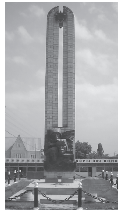
Хл.Амирчупанов Суратуни Д-Хл. Даудовли касибти сари

Газетализи кадыхъибти материалтала авторгани чула белкнализир гъандушибти баянтала, далилтала, экономикала, статистикала шайчирти луглурбала, адамтала, мер-мусала умала ва цархилти мисалтала дурусдешунала шайчир жавабкардеш дихути сари даклу-гъаргли кадыхъес асухлебирути баянти материалтазир, хледиахънила шайчирра.