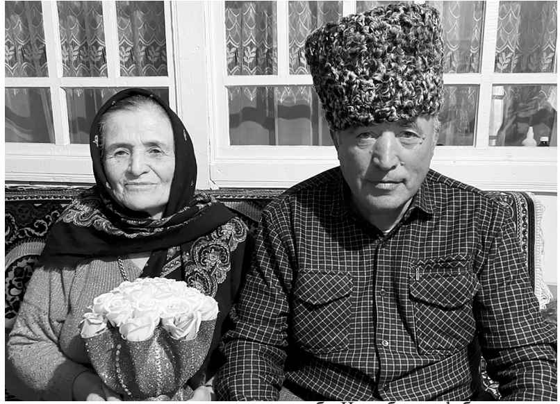
шантала х1урмат ва диги сар- хиб. Чучибад аклубтира чула