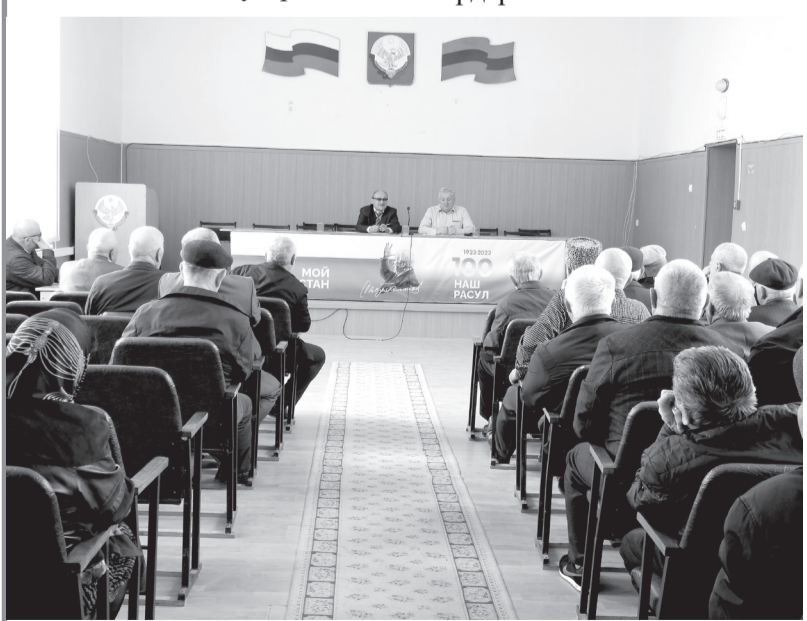
дявила ветерантала Советунала - районнизиб х1ербирути

ла заседание бетерхур. Заседаниеличир г1ергьити суалти х1ердариб: