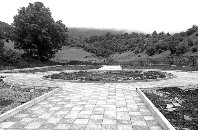
Парк в с.Мургук

Проект «Успех каждого ребенка» Зарегистрированы 7 школ на платформе проекта «Билет в будущее». Выбран педагог-навигатор, который заполнил анкету на сайте. Со 2 по 20 сентября 95 учащихся 6-11 классов прошли регистрацию. С 20 по 30 сентября все зарегистрированные учащиеся прошли 3 этапа тестирования.