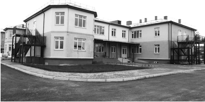
Детский сад в с.Мюрего

За прошедшие годы в районе нам удалось решить один из существенных вопросов – качественное проведение ЕГЭ. В 2021-2022 учебном году в общеобразовательных организациях Сергокалинского района 145 выпускников вошли в базу ЕГЭ. На передаче из восьми учащихся двое учащихся смогли передать основные предметы и на сегодняшний день 6 выпускников района остались без аттестата. Сдали ЕГЭ по русскому языку 145 выпускников. Успеваемость составила 94,5%, средний балл – 51,8. По сравнению с прошлым годом средний балл снизился на 11 баллов. Не справились со сдачей ЕГЭ по русскому языку 8 выпускников: МКОУ «Балтамахинская СОШ», МКОУ «Бурхимахинская СОШ», МКОУ «Ванашимахинская СОШ», МКОУ «Маммаульская СОШ», МКОУ «Мургульская СОШ», МКОУ «Новомугринская СОШ», МКОУ «Сергокалинская СОШ №2» - 2.